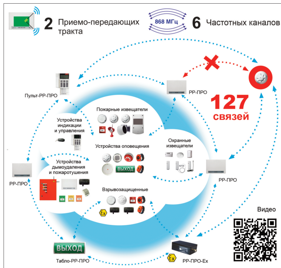
Рис. 1. "Стрелец-ПРО" соответствует требованию о единичной неисправности

Радиоканальные системы безопасности ничем не отличаются, а во многом даже превосходят проводные в своей надежности. Радиоканал, по сравнению с кабельными линиями, сохраняет работоспособность даже во время пожара. Это позволяет отследить траекторию распространения огня, а резервирование линий связи между устройствами обеспечивается с большим запасом, что гарантирует доставку сообщения о возгорании на приемно-контрольный прибор